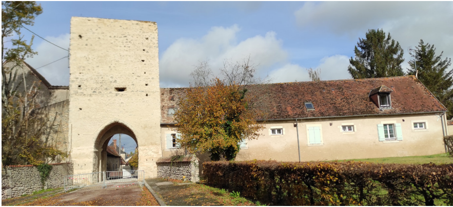
La porte de ville Sud