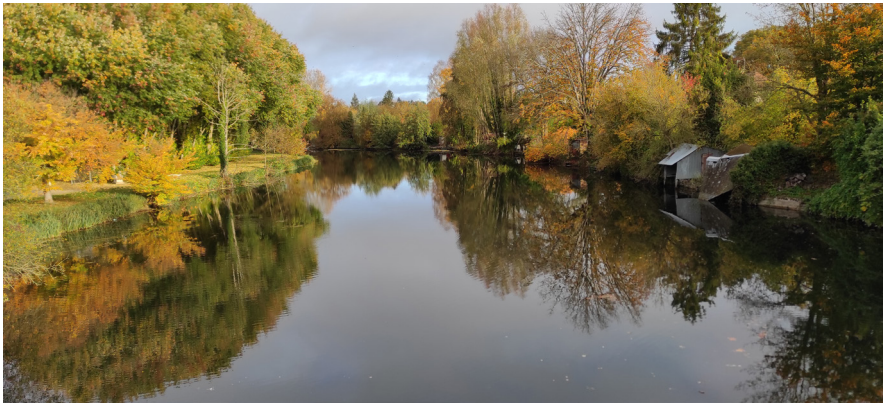
Vue sur l'Arnon