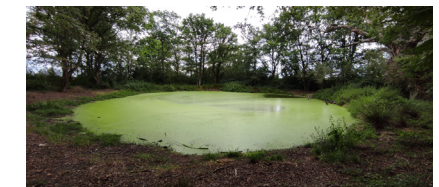
La mare de Graviau